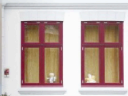
„Antik“: Die Fenster und der große Saal sind im klassischen Stil gehalten.